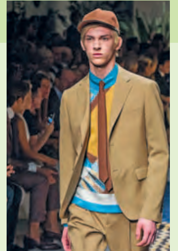
Baseballcap tijdens de show van Salvatore Ferragamo.