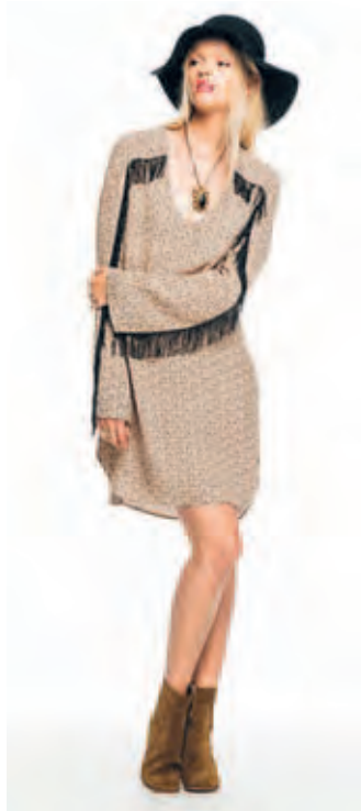
Jurk met franjes van Maison Scotch (€ 149,95)