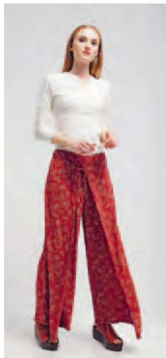
Broek van Denim & Supply – Ralph Lauren, via Zalando (€ 89,95)