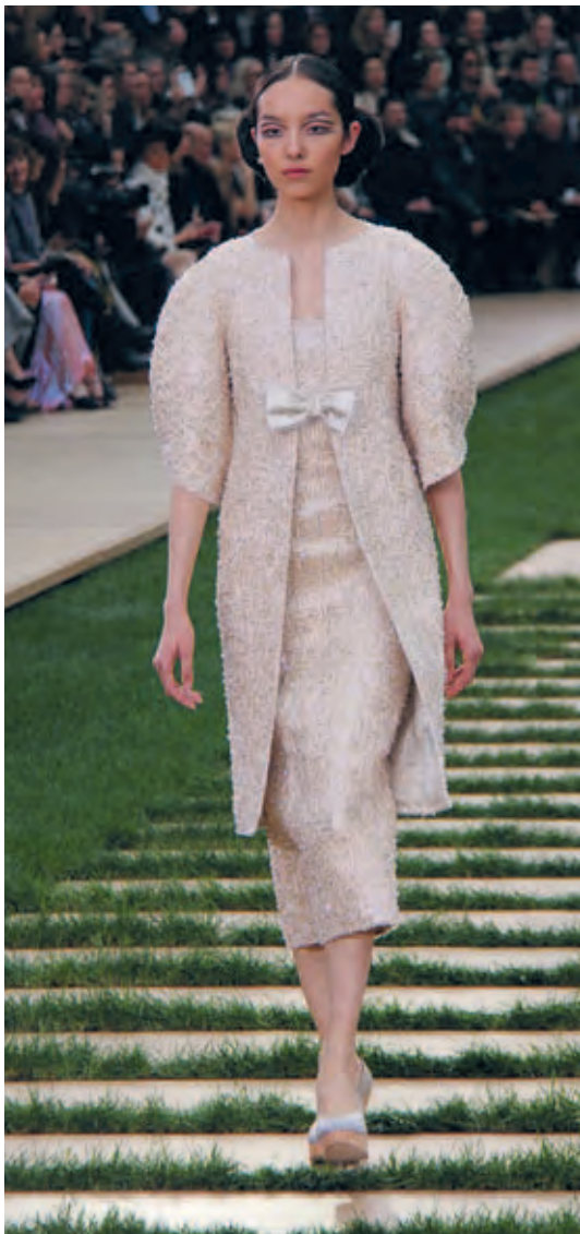
Jas met pofmouwen van Chanel.