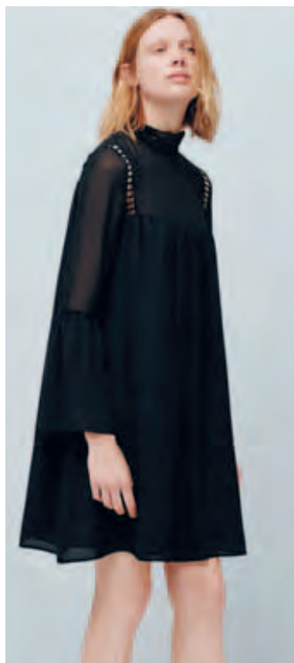
Jurk met uitlopende mouw van Mango (€ 49,99)