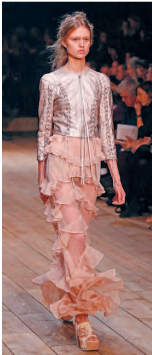
Trends op de catwalk. Franjes en ruches bij de show van Alexander McQueen.