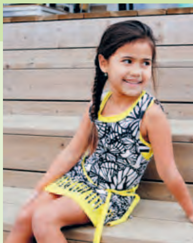
Jurkje van LoveStation22 (€ 24,95)

Een betaalbare legging met grappige prints of een peperduur designpakje voor je kleine meid of jongen? Het is volgens Pascalie allemaal prima, 'zolang kinderen maar kinderen kunnen zijn en hun ouders niet boos worden als iets vies wordt. Kinderen spelen en worden vies; dat hoort er nou eenmaal bij.' In de kindermode zijn dit seizoen geen heel opvallende trends te onderscheiden volgens de styliste. 'Het is een soort mix van wat je al zag. Het ligt natuurlijk ook aan de leeftijd, want tussen de mode voor baby's en kinderen van tien zit een wereld van verschil. Over het algemeen zie je ook dit seizoen weer kleding die gemaakt is van zachte stoffen met veel vrolijke kleuren en prints. Maar ook de monochrome trend, dus veel zwart-wit, zien we terug.'