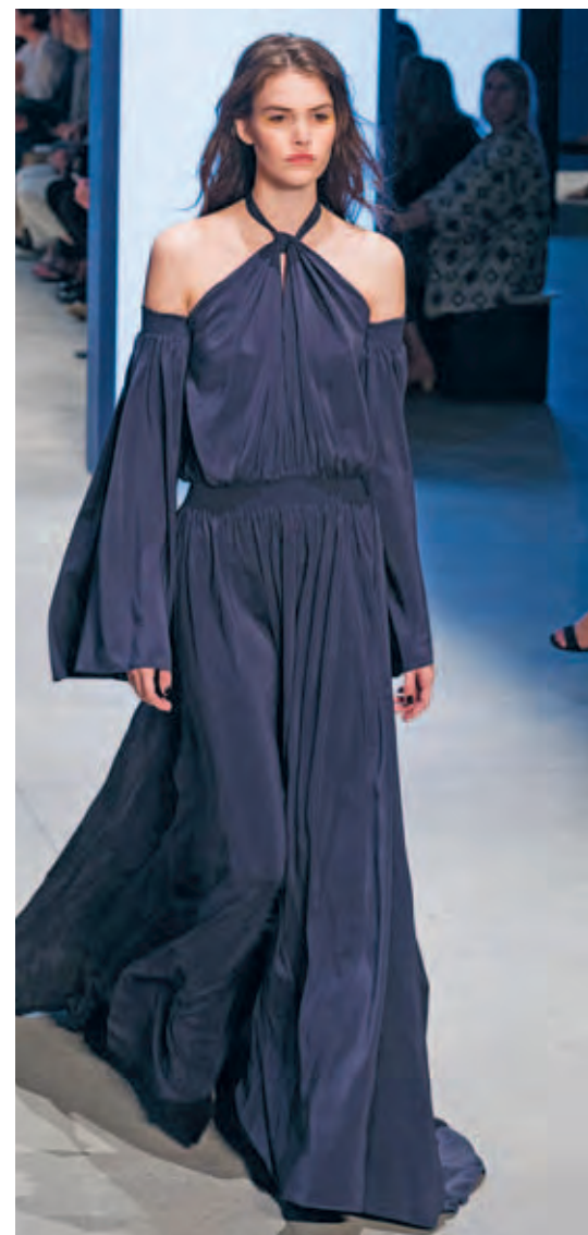
Off shoulder jurk van Derek Lam.

Welke modetrends gaan we dit voorjaar terugzien in de winkels? Tijdens de modeshows voor het aankomende seizoen waren het vooral de uitlopende mouwen en pofmouwen die Koldenhof opvielen. 'Deze mouwen, die smal beginnen en onderaan uitpoffen of bol beginnen en smal toelopen, creëren een heel mooi silhouet. Het maakt niet uit hoe zwaar of hoe licht je bent, deze trend staat iedere vrouw mooi.'