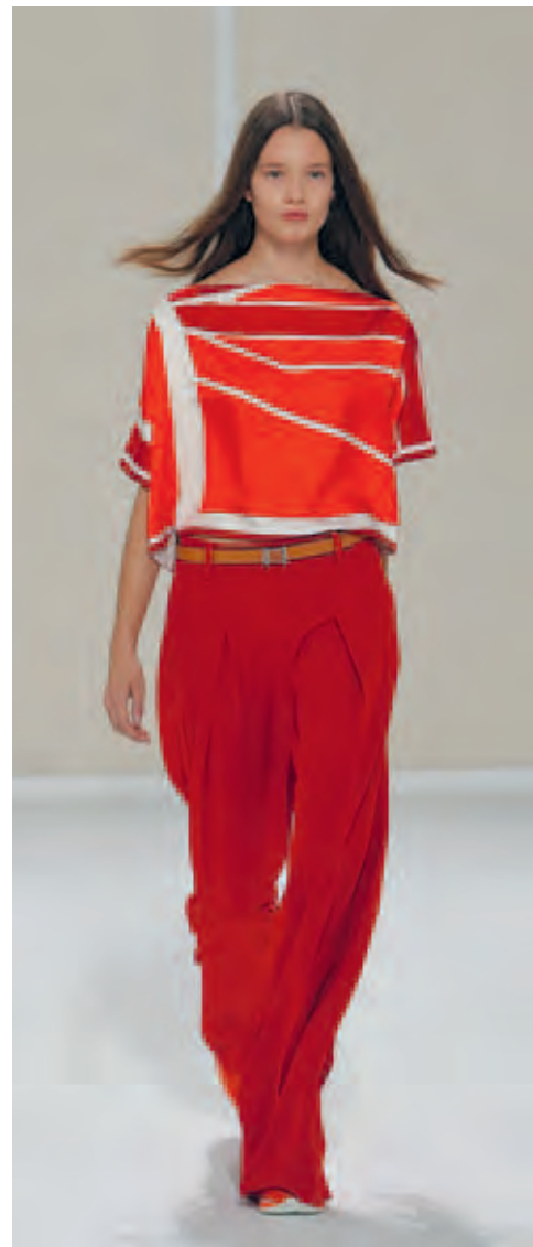
Soepelvallende broek van Hermès.

Op de catwalks waren sommige modellen van top tot teen in franjes gehuld. 'Bij de modeshows is alles natuurlijk in overtreffende trap, maar ik denk dat deze trend zich in de winkels zal vertalen tot een heel subtiele en draagbare stijl. De franjes worden vooral toegepast in soepele en vaak doorzichtige stoffen, wat een heel romantisch gevoel geeft en met de franjes op de juiste plaats kun je voor ieder figuur een mooi silhouet creëren.'